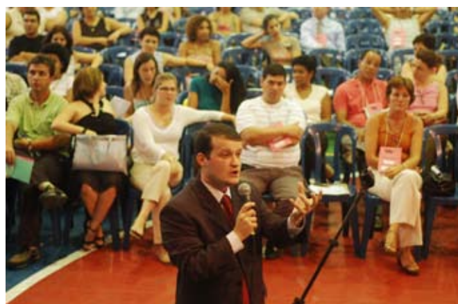
Cooperados expressam suas opiniões.