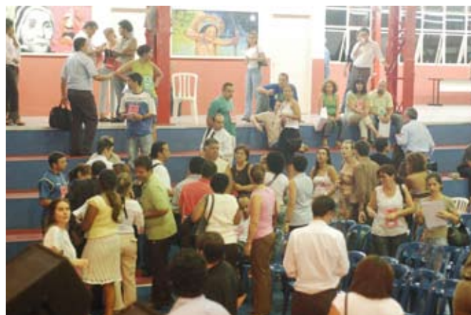
Cooperados marcam presença na assembleia.