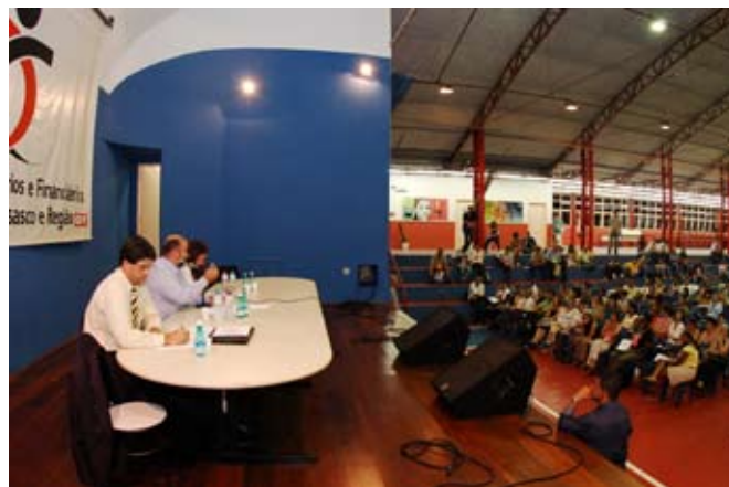
Representantes da Bancoop passam informações aos cooperados presentes e coordenam a assembleia.