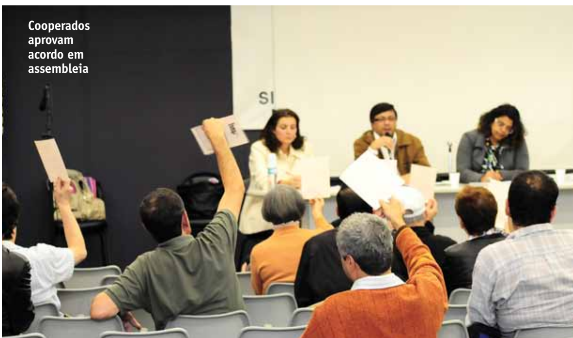
Cooperados aprovam acordo em assembleia